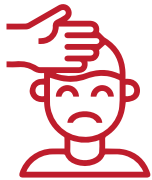
Dolor de cabeza

- En el 3rea de observaci3n, personal de salud debe informarle que reacciones podr3an presentarse principalmente en los dos d3as siguientes a la vacunaci3n, las que se describen en la secci3n de eventos supuestamente atribuibles a vacunaci3n o inmunizaci3n (ESA VI).