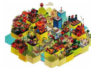
Control de la Tuberculosis en Grandes Ciudades de Latinoamérica y el Caribe Lecciones aprendidas